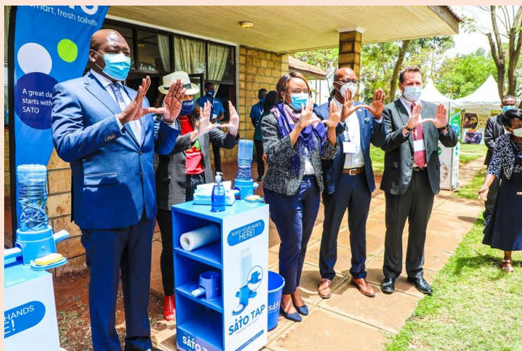
Global Handwashing Day.

Amref ist seit 2002 mit einem eigenen Ableger in Äthiopien aktiv und hat derzeit etwa 200 Mitarbeiter im Land. Die Organisation arbeitet hier mit den Behörden und anderen NGOs zusammen, um die gesundheitlichen Bedürfnisse der äthiopischen Bevölkerung zu bedienen. Ein zentraler Punkt ist auch hier die Förderung von WASH-Angeboten , also der Zugang zu sicheren Trinkwasserquellen und Sanitäranlagen . Laut eigenen Angaben konnte Amref mit diesen Aktivitäten im Jahr 2019 1.3 Millionen Menschen in Äthiopien erreichen und damit Zugang zu Wasser, Hygieneprodukten und sicheren sanitären Anlagen verschaffen.