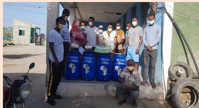
Aufbau von Sanitäranlagen.

Homepage: https://africahumanitarian.org/