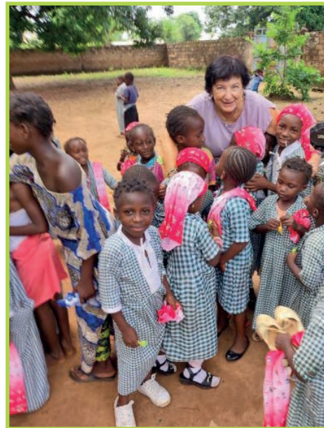
Foto: Unsere Schulkinder warten auf ihren Lehrer, damit er ihnen das Schultor öffnet © Fischernetz der Hoffnung