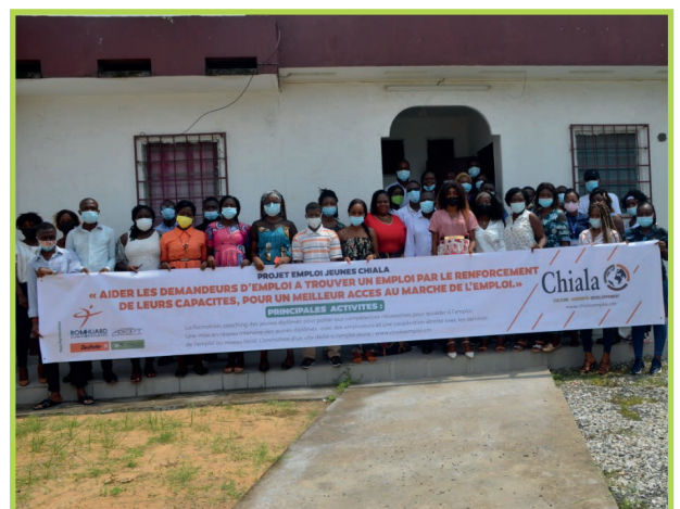
Foto: Kinder und Jugendliche, die ein Ausbildungsmodul bei Chiala Douala absolviert haben