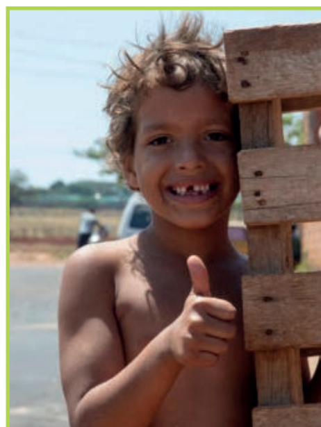
Foto: Kinder aus der Region Juazeiro/Brasilien, Ernst Zerche © Welthaus Graz

Neben der Bildungsplattform wird auch das Projekt „Gut leben mit der Trockenzone“ in der Region Juazeiro, Brasilien mittels Fotos vorgestellt. In diesem Projekt unterstützt das Welthaus junge Menschen dabei, selbstbewusst jenen Beruf auszuwählen und zu erlernen, der ihnen ein gutes Leben vor Ort ermöglicht. Durch die geringen Niederschlagsmengen und die geringe Wasserspeicherfähigkeit ist ein angepasster Umgang mit den natürlichen Ressourcen erforderlich. Der vor Ort ansässige Projektpartner IRPAA (Regionales Institut für angepasste Kleinbauernlandwirtschaft und Tierhaltung) fördert durch Schulungen, einen an die Region angepassten Lehrplan und Aktivitäten mit Kindern und Jugendlichen den ganzheitlichen Ansatz der Convivencia – des Zusammenlebens mit dem semiariden Klima. So werden allmählich die negativen Vorurteile, mit denen die Region behaftet ist, verringert. Indem junge Menschen selbstbewusst jenen Beruf auswählen und erlernen können, der ihnen ein gutes Leben vor Ort ermöglicht, kann eine Abwanderung vermieden werden.