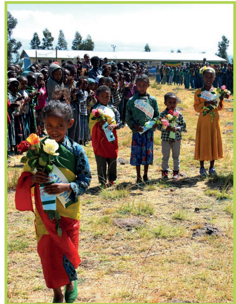
Foto: Eröffnung der von Way2Help finanzierten 7. und 8. Schulstufe der Schule in Workegur/ Nord Shoa 2017, mit sichtbarer Begeisterung aller Beteiligten © Way2Help