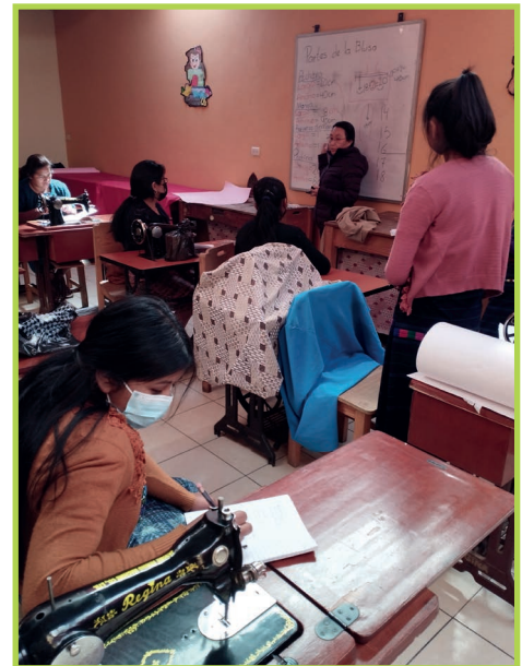
Foto: Bilder von der Ausbildung, von den Werkstätten, von Menschen die ihre Kurse abschließen konnten © SOL