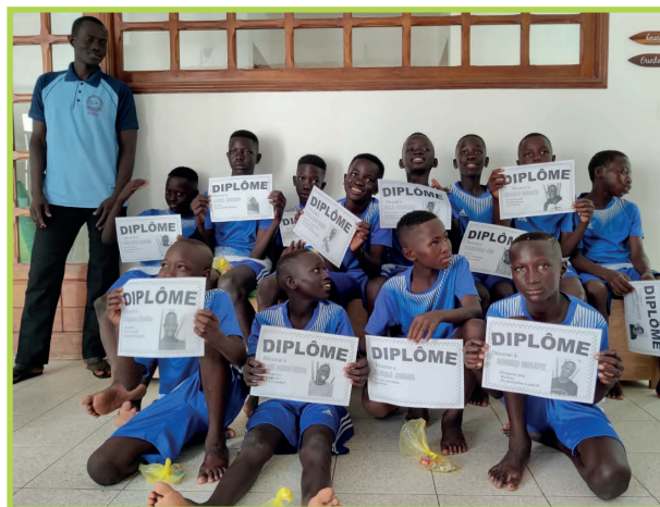
Foto: Auf dem Foto sieht man die Buben des Alphabetisierungsprogramms mit ihren Diplomen

Es wird derzeit 67 Mädchen der Besuch der Volksschule ermöglicht. Weiters gibt es ein Internat für Vollwaisen, eine Tagesheimstätte mit Alphabetisierungsprogramm für 10 bis 20 Buben und Näh- und Informatikunterricht nach der Schule. Alle Kinder bekommen medizinische Betreuung und zwei Mahlzeiten pro Tag, auch in den Ferien. Die Eltern sind in das Programm miteinbezogen. Eine staatliche Stelle sorgt für Rechtssicherheit.