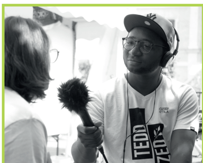
Foto: Peninah Lesorogol & Saifullahi Abduarazak am FairStyria-Tag 2022 © Radio Helsinki