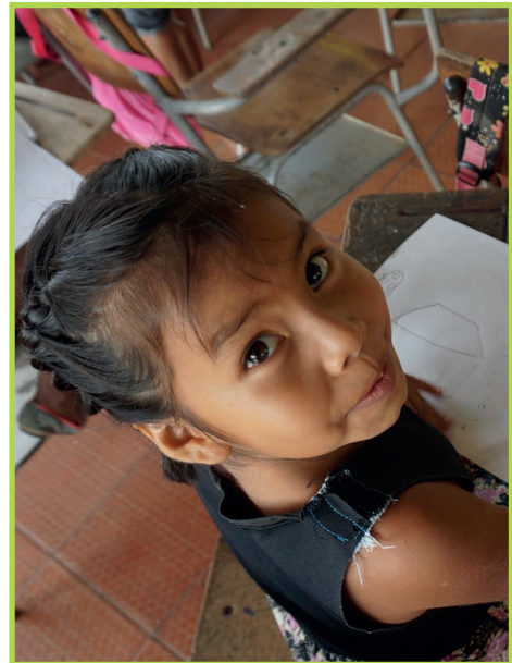
Foto: Mädchen in Schule in Guaviare, Kolumbien, lernt über Umweltschutz, und wie es und seine Schule aktiv dazu beitragen können

Stärkung der Qualität der ländlichen Bildung im Hinblick auf die Förderung des interkulturellen Dialogs, der sozioökonomischen und der territorialen Entwicklung; dauerhafter Frieden und nachhaltige Nutzung natürlicher Ressourcen (insbesondere Wasser) durch qualitativ hochwertige und angepasste Bildung. Das Projekt hat zum Ziel, die Flussbeckenregionen Agua Bonita und Rio La Maria in der Provinz Guaviare im Amazonasgebiet Kolumbiens nachhaltig zu schützen.