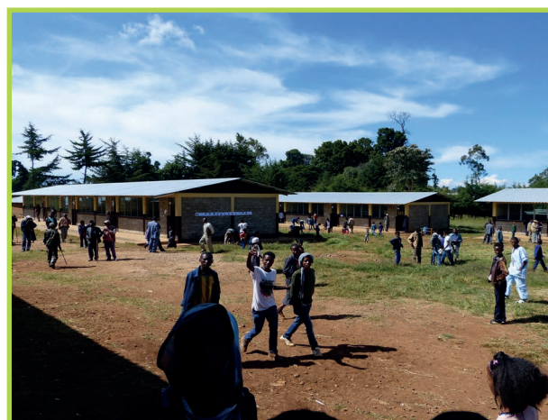
Massive Ziegelbauten mit großen Lamellenfenstern sorgen für eine helle Lernatmosphäre wie hier in der Provinz Gindeberet

Das Land Steiermark unterstützte die Errichtung der Yekema-Schule (Region Nono Sele), Berbabo Higher Primary School (Bezirk Ginde Beret) und Chulute Higher Primary School (Ginde Beret Woreda, West Shoa Zone).