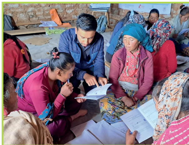
Foto: Training der Frauen für biologischen Gemüseanbau – theoretisch und praktisch