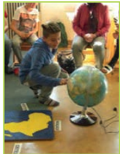
Foto: Projektbeginn in der Schule – den Kontinent Afrika kennenlernen