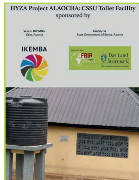
Foto: Saubere Sanitäranlagen im gelben Gebäude. Links steht der Wassertank, welcher mit Wasser aus dem Projekt „Wasser ist Zukunft für Alaocha – WaZA“ versorgt wird. Oben im Bild: Fördergeber des Projekts