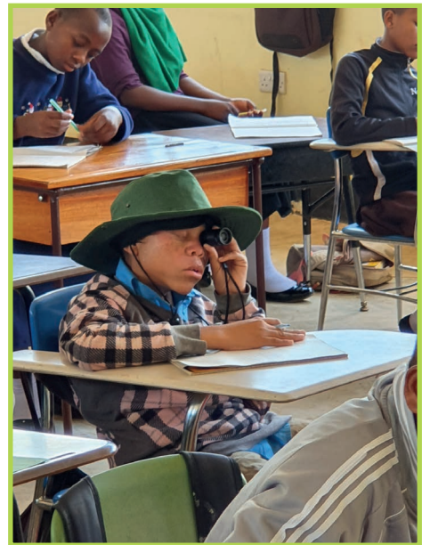
Foto: Kind mit Albinismus und mit Sehproblemen studiert mit einer Sehhilfe den Tafeltext in der Secondary school von St. Pamacchius © Lebenshilfe Steiermark

Derzeit wird an der Installierung einer inklusiven Forstschule am Kilimanjaro gearbeitet. Damit soll auch eine Schulpartnerschaft zwischen zwei steirischen Schulen und der Schule am Kilimanjaro aufgebaut werden. Zusätzlich läuft bereits ein Austauschprogramm zwischen der Pädagogischen Hochschule Steiermark und der katholischen Universität in Moshi. Ziel: Gegenseitiger Austausch und Kompetenztransfer in Bezug auf inklusive Pädagogik.