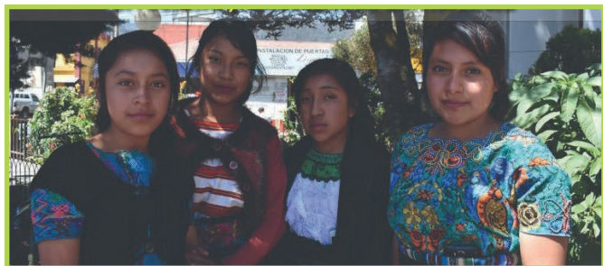
Foto: Wir haben das Recht auf einen Schutz vor sexueller Ausbeutung, Rassismus und andere Formen der Gewalt an Frauen

Information und Bewusstseinsbildung für Mädchen und Frauen in Guatemala und hier in Österreich, weil die Erfahrungen von Gewalt weltweit ähnliche sind.