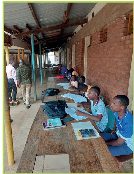
Foto: Besucher des Social Education Center in Morogoro lernen für ihre Abschlussprüfung