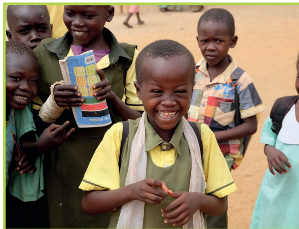
Foto: Kinder der Primary School in Lologo/Juba, Südsudan, Projektpartner: Saint Vincent De Paul Society © Caritas Auslandshilfe