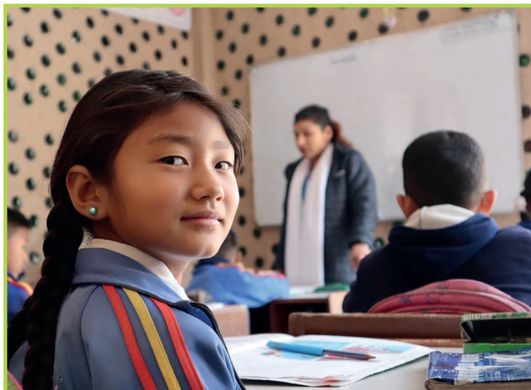
Foto: Schüler*innen der Kundalinee School, Nepal © Weltweitwandern Wirkt!

In Entwicklungsländern haben Kinder aus armen Familien oft keine Möglichkeit, hochwertige Bildung zu erlangen. Doch nur mit guter Bildung haben sie eine Chance, aus der Armutsfalle auszubrechen. Durch die Präsentation unseres Vereins und den Blick in ausgewählte Projekte werden steirische Schüler:innen für EZA und die Rolle und den Wert von Bildung in diesem Kontext sensibilisiert.