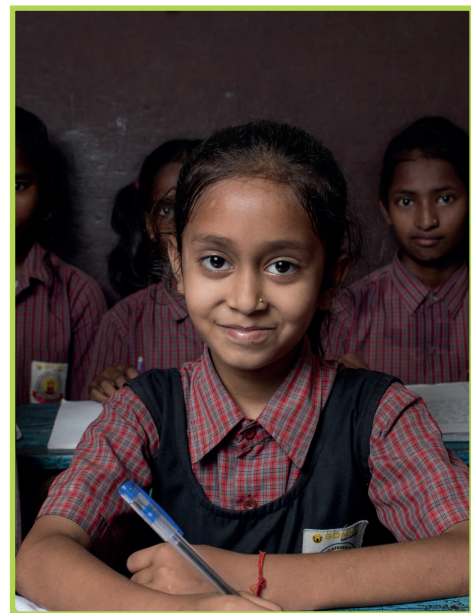
Foto: Schüler:innen in der SONNE-Schule im indischen Dorf Bakraur, Indien © SONNE International