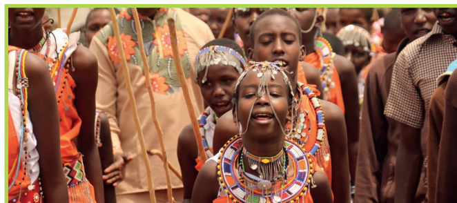
Foto: Begrüßung durch die Schulkinder © Arbeitskreis Weltkirche Graz-St. Andrä